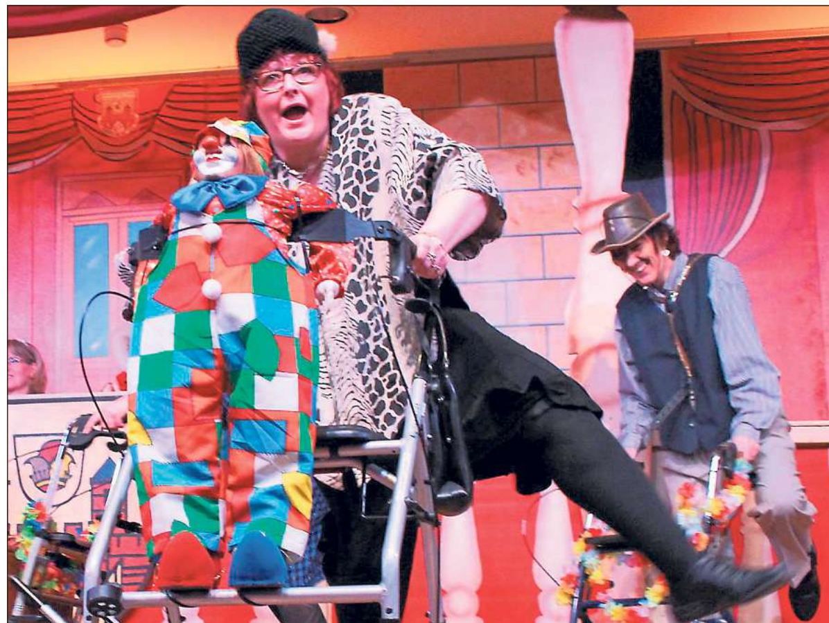
Rockiger Umgang mit dem Rollator: Eine Aktive der Altweiberriege geriet außer Rand und Band beim Seniorenseniorenkarneval im Rietberger Schulzentrum.